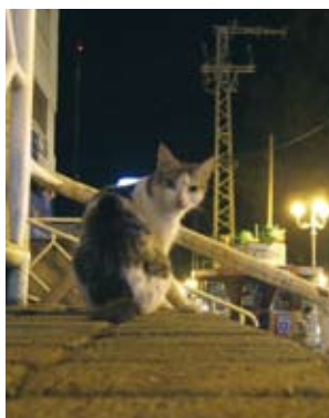
נהריה האמיתית, הרחק מהטיילת ההומה

לפנינו ומתגלה כאחת מטיילות החוף היפות בארץ. הכל בה לבן, עיצובה מוקפד. היא נקייה, פתוחה אל הים, נושקת לו. לא כמו זו של עכו, הסכורה בחומת אבן נמוכה ומקוממת. ואז גם מופיעים הפאבים, המועדונים, המסעדות. בבת אחת העירוניות מכה בנו. אחרי יותר משלוש שעות הלילה כה בחופים שוממים וחשוכים, עורף הגירויים מסנוור אותנו. צעירים וצעירות בני עשרה, מהרסים אנה ואנה במיטב מחלצותיהם, ממלאים את האוויר בריחות בושם עזים והורמונים. השירים של שרית חרד מתערבלים במיקס לא הגיוני עם שיריו של בוב מארלי. אנחנו יושבים מול הים באוויר הקי ריר של חצות וקצת, ומוזגים אל תוכנו אלוהות לקינות. עומר מצלם עדר של נערות צווחניות שמתגודד בסמוך. הן קולטות אותנו ונמלטות, כמו להקת זכרות שהבחינה בטורף. רק אחת נותרת על עומדה, חוככת בדעתה, ואז פונה אלינו בצעדים מהירים. "תמחק את התמונות שלנו מיד!" היא פוקדת. "אם לא - אני אקרא למשטרה". חברי תיה מציצות בה ממרחק בטוח. אנחנו מגחכים קלות ואומץ לבה מתפוגג מיד. הנה עוד יתרון בלעבור את גיל 40: אתה כבר לא מפחד מנערות זועמות. מכאן, בכוחות אחרונים, אנחנו מזרחלים אל שדרות הגי עתון, שקריות על שמו של הנחל הקלוש שזורם במרכז. לא מעט נביעות מלוות אותו ממקורותיו בדרכו אל הים, אך רובן משמשות להשקיה. למרות זאת, גם ברוזיפיותו הוא מענג, מציף אותנו בנוסטלגיה של טיולי ילדות. לנהריה אין עבר. יש לה נוסטלגיה שעדיין מתרפקים עליה. אפילו הכרכרות המפורסמות חזרו אל העיר, והן חגות בה בחדשי הקיץ. במקום עגלונים נוהגות בהן צעירי רות שלובשות לבן מכף רגל ועד ראש. הכרכרות עצמן,