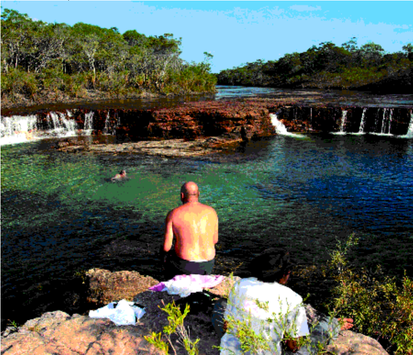
למעלה: מתרחץ נח ליד מפלי פרוט בט. בעמוד מימין למעלה: שטחי מרעה באזור נהר פאלמר (Palmer River). מימין למטה: אחד השיאים של אוסטרליה הוא המספר הגדול של יונקי כיס

יורק אל עבר הציביליזציה. בשנת 1964 הופסקה פעילותו של הקו וכיום כמעט לא נותרו בו עמודי ממסר. רובם נעקרו על ידי חוואי האזור ושימשו חומרי גלם לצרכים שונים, ואחרים הוסרו בידי מטיילים מקומיים שביקשו לקחת עמם מזכרת היסטורית. הדרך בדרך כלל צרה ומתעקלת, והג'יפים חולפים בסמיכות מבהילה לצד עצים עבי גזע ותלי טרמיטים אימתניים. לאחר יום נסיעה מפרך אנחנו מגיעים בשעות הלילה אל גדות נהר ג'ארדין (Jardine River), שאותו נחצה בבוקר, בדרךנו לנקודה הצפונית ביותר ביבשת אוסטרליה – The Tip. בני האדם נוהגים לחפש (ולמצוא) משמעותיות סמליות בעולם הגיאוגרפיה. מנעיצת דגל על פסגת הדר הגבוה ביותר ועד השתרעות לחופיו של הים הנמוך בעולם. לאחר מסע ארוך, מייגע וגרוש הרפתקאות,