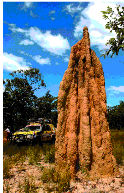
למעלה: אחד מתלי הטרימיטים הרבים הנראים לצד הדרך. מימין: מבט ממעוף הציפור על ה"טיפ" (The Tip), הנקודה הצפונית ביותר ביבשת

ביום שלמחרת אנחנו מותירים מאחור את תענוגות העיר הקטנה ופורים נים בשיירה ארוכה צפונה על קו החוף, לכיוון העיירה קוקטאון (Cooktown). מנקודה זו צפונה מתגוררת רוב אוכלוסיית קייפ יורק בחוות בקר עצומות ממדים, בקהילות אבוריג'יניות ובעיירות זעירות שנבלעות בין מרחבי הפארקים הלאומיים. לצד הכביש נמתח החוף הלבן שמעטרים אותו סלעי שחורים, דקלים זקופים ומנגרובים. צדו האחר של הכביש נושק למצוקי הגרייט דינוידינג ריינג' וגרוש בסבך טרופי צפוף. העיירה מוסמן (Mossman) מסמנת לנו להיכנס אל