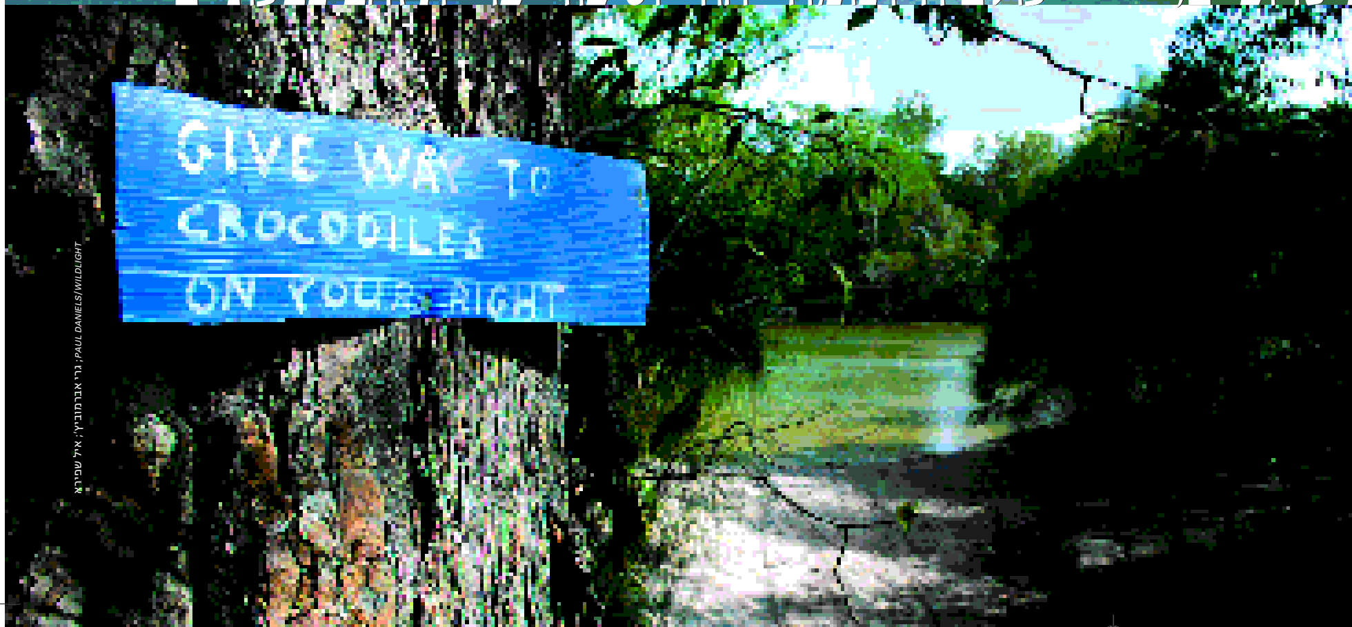
ניר אדמונדסון, איל שפירא

חצי האי קייפ יורק - חבל ארץ מבודד, פראי ובתולי אל שונית המחסום הגדולה, טיולים ביערות טרופיים,